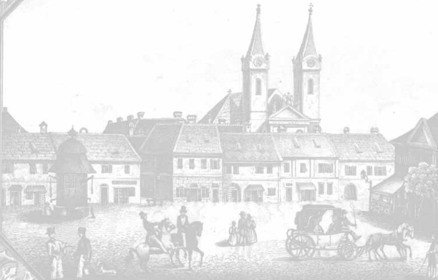
Szombathelyi piac. Steinamanger Platz

seine Verbindung mit dem Komitat Vas zusammen. Die beiden Grabreden geben bisher unbekannt Informationen über den Tod Batthyánys am 26. Oktober 1765 in Rechnitz, sowie den Umständen seiner Bestattung am 21. Februar 1766 in Güssing. Die Verbindungen mit dem Komitat Vas existieren in erster Linie mit den Bauten der Kirche und des Schlosses, sowie seiner Gespanschaft.