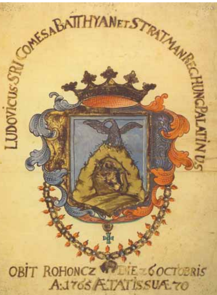
4. kép. Batthyány Lajos halotti címere. Hadtörténeli Múzeum, ltsz.: 99.135.1./KE Abb. 4. Todeswappen des Lajos Batthyány, Militärhistorisches Museum, Fundnummer: 99.135.1./KE

Posztókkal bé vontt szegleti, ezt hirdetik á gyász színbe öltözött Oltárok, és azokra függesztett Czimerek.” (Csödy 1766. 5). Nem vették tehát figyelembe a nádor végrendeleti kérését, miszerint holttestét minden pompa és ünnep nélkül helyezték el a németújvári családi kriptában utódai jelenlétében. 7 A halotti beszéd szövegében említett négy oszlopos halottas épület a castrum doloris elnevezésű, főúri temetésekben használt építmény volt, mely a szertartás idején a koporsóba tett holttestet magába fogadta. Csödy utalt a nádor halotti címereire, melyek közül egy maradt fenn a Hadtörténeli Múzeumban. A 60x45 cm nagyságú papírra a művész a grófi Batthyány címet festette, kiegészítve az Aranygyapjas Rend és a Szent István Rend ábrázolásaival, mindezek alatt pedig a nádor elhalálzásának helye és ideje olvasható. (BAJÁK 2006. 245–248) (4. kép).