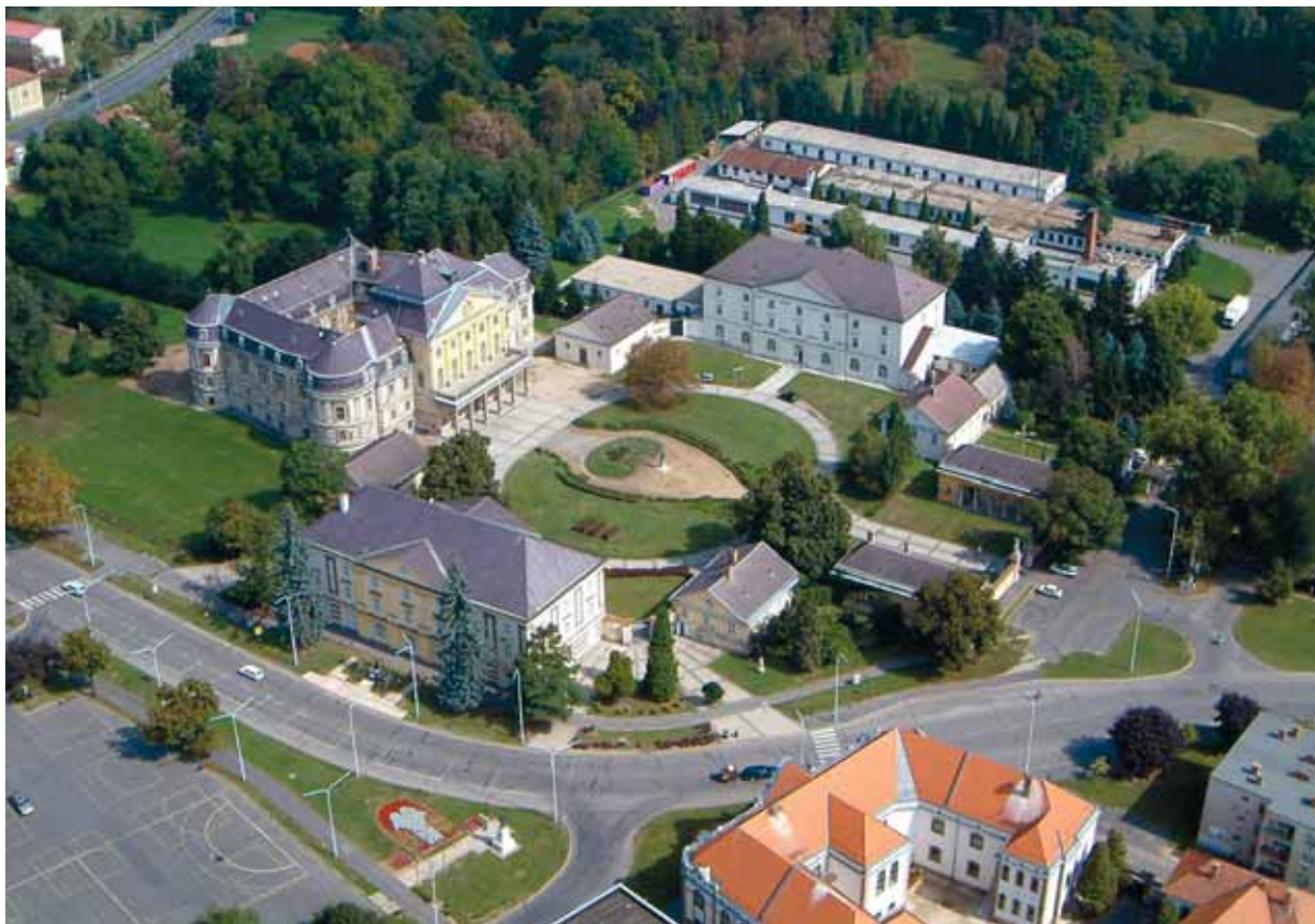
7. kép. A kőrmendi Batthyány kastély épületei Abb. 7. Das Gebäude des Batthyány Schlosses in Kőrmend

A Rákóczi-szabadságharc után a Batthyány uradalmak központjává tett Kőrmendet az ország egyik leggazdagabb arisztokrata családjához méltóan kellett kiépíteni. A legnagyobb beruházást a vár barokk kastéllyá való