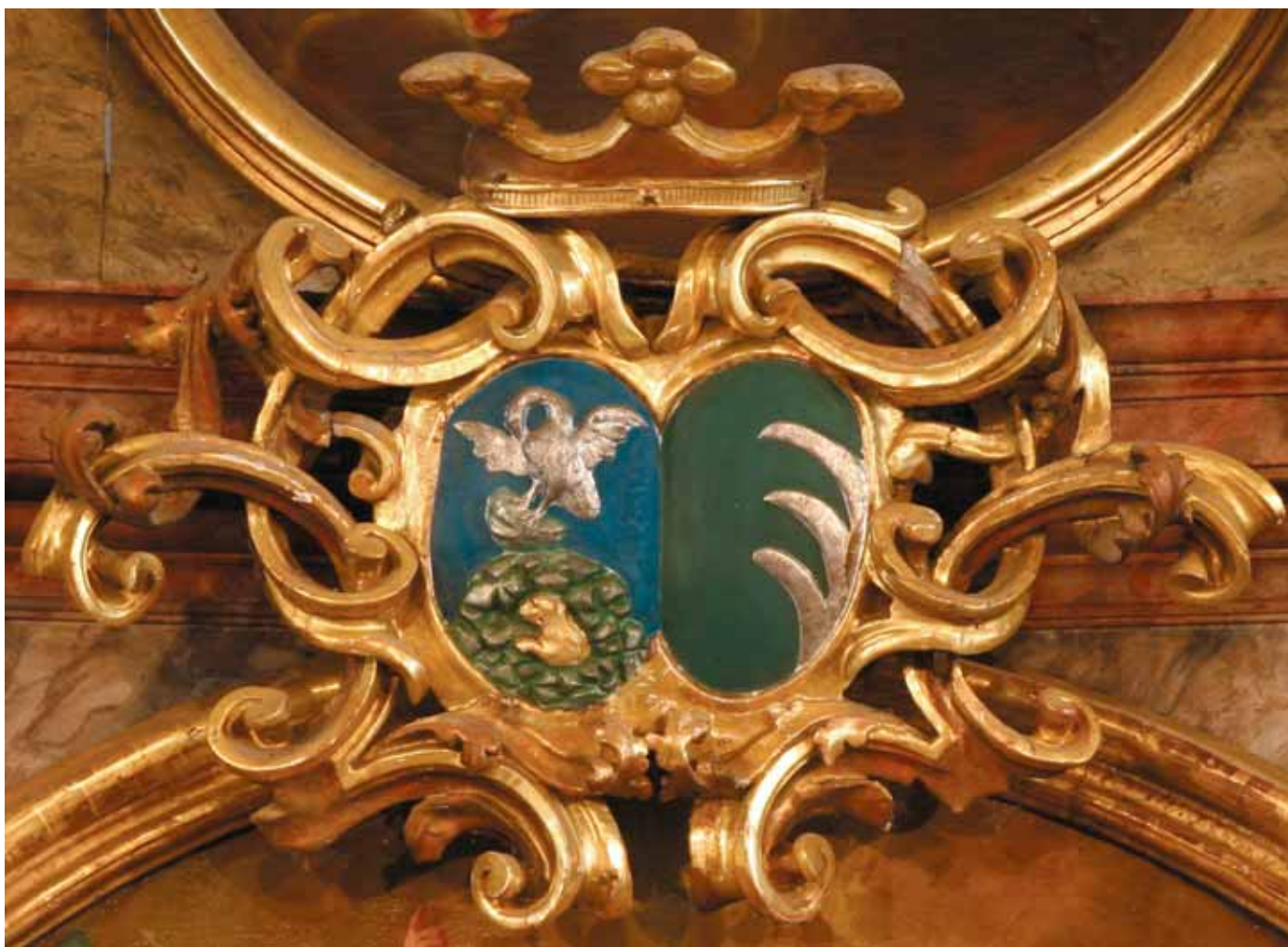
10. kép. A főoltár Batthyány-Kinsky címere Abb. 10. Das Batthyány-Kinsky Wappen des Hauptaltars

A Vas vármegyei főispánság mindkét halotti beszédben több alkalommal felbukkan. Batthyány Lajos 1727 és 1762 között töltötte be a Vas vármegyei főispáni pozíciót, bár örökös Vas vármegyei főispánná már 1716-ben kinevezte III. Károly. Az aktust Galgóczy is említette művében: „Ez indította-meg a’ Császárt, és Királyt, hogy Lajosnak sok rendbéli hűvséges szolgálattját, s’ az ő hivatallában tett érdemeit a’ Tekéntetes Nemes Vas Vármegyének örökös Fő-Ispányságával meg-juttalmazná: úgy hogy még a’ Maradéki – is éreznék hasznát az ő Édes Attyok érdemeinek, ’s általa a’ Királyi kegyelem reájok – is el – terjedgyen.” (GALGÓCZY 1766. 16–17). Főispáni tevékenységére azonban csak egyetlen eseményt hoztak fel a halotti beszédek, mégpedig az oszt-rák örökösödési háború insurrectio-jával kapcsolatban. Ekkor Batthyány Lajos fiát, Ádámot állította a vasi nemesi felkelők élére: „Ez a példa indította-meg leg jobban