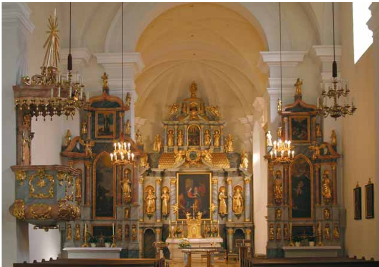
2. kép. Ferences templom, Németújvár (Güssing) Abb. 2. Franziskanerkirche, Güssing

drága arany sinórát el mecsette. (...) Nagy Mester vala halála üdején, mert harmad Napig tartó Töredelmességével, és az alat két vagy három-izbéli Gyónásával, – s annyiszor á Kristus Testének magához vételével minket – is tanéta. ” (Csödy 1766. 4).