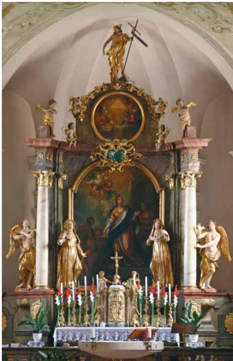
9. kép. A körmendi Szent Erzsébet templom főoltára Bild 9. Der Hauptaltar der Sankt Elisabeth Kirche in Körönd

Azonban nemcsak templomépítésekkel szolgálta egyházát, hanem azzal is, hogy a kemenesaljai evangélikusoktól elvett templomokat a katolikusoknak adta: „... Tekéntetes Nemes Vas Vármegyének egyik része, mellyet Kemenesallai Processusnak nevezünk. Ennek sok helyeit, és Templomait, úgymint Miskeit, Mihályfait, Ságít, Nadasit, 10 s a többieket, az előbbenni boldogtalan időkben el-foglalta az új tanítás, és vidéki vallás: következő képpen az Istennek igaz szívből származott tisztelete, s az ő Szent Igéinek igazán való hirdetése, számkivetésbe voltak azon helységekbe. Gróff