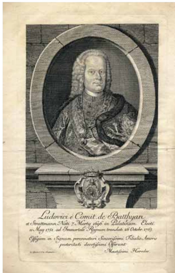
1. kép. Batthyány Lajos ábrázolása Galgóczy Ferenc művében Abb. 1. Darstellung des Lajos Batthyány in dem Werk von Ferenc Galgóczy

Batthyány Lajos 1765. október 26-án hunyt el rohonci várában. Haláláról eddig mindössze egy korabeli naplófeljegyzés volt ismert. Johann Josef Khevenhüller-Metsch császári főudvarmester feljegyzéséből csak arra derült fény, hogy a nádor kólikában halt meg rohonci birtokán (KHEVENHÜLLER-METSCH-SCHLITZER 1917. 149). A két halotti beszéd éppen halálával kapcsolatban hordozza a legtöbb új információt. A Galgóczy Ferenc által írt beszéd csak szűkszavúan említette a nádor halálát: „... az el-múlt Ezer hét száz hatvan ötödik Esztendőben, Mind Szent Havának 26-dik napján a' maga örökös Várában Rohonczon minden szükséges Szentségekkel élvén, 's el-készülvén bódogúl ki-múlt ez árnyék világból.” (GALGÓCZY 1766. 6). A Csódy Pál-féle beszéd már a betegség hosszáról és Batthyány többszöri gyónásáról